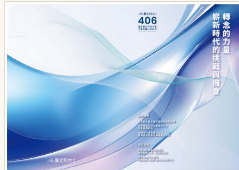
第 406 期校訊