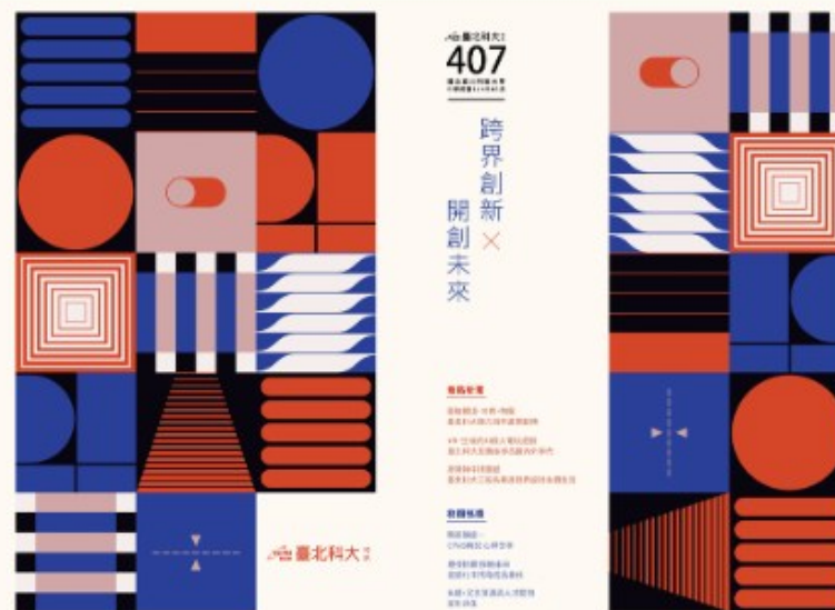
第 407 期校訊