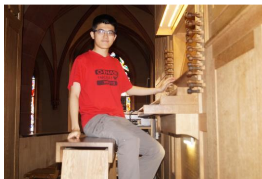
巴登巴登 Stiftskirche 的管風琴