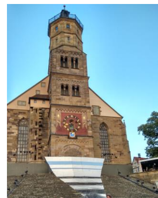
音樂劇欣賞-演員以教堂陡峭的台階為舞台

德國的平日生活，總令人陶醉，準時下班後聚在花園享用晚餐，夜幕低垂時，燃起蠟燭、坐在躺椅上喝著酒、聊天、觀察飛機、或是快速飛過的人造衛星、或流星雨，有時發現野生刺蝟、蝙蝠，也是一大樂趣，再由我的提琴樂音做個收尾。