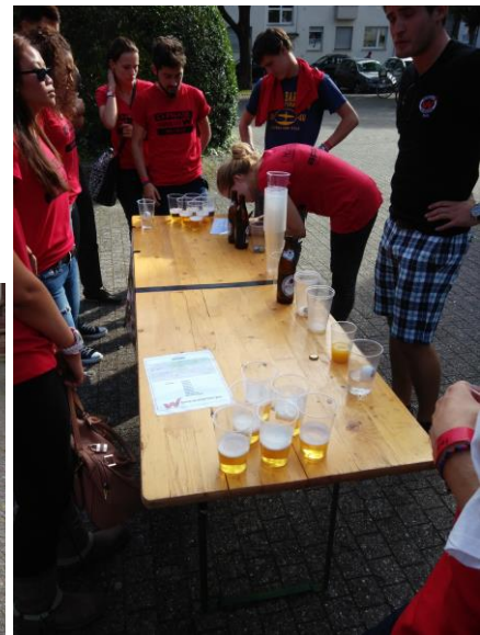
學校迎新-每個關卡都有酒