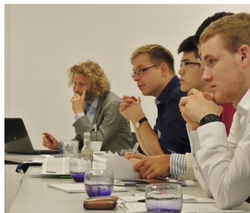
URG Policy Platform

另 104 年 2 月，通過徵選，參加聯合國 Universal Rights Group 的論壇- „URG Policy Platform: From Religious Dialogue to Human Rights, Particularly Women and Children’s Rights “，約 20 位來自世界各地的人權、宗教專家與會。論壇探討的層面深、專家們互相質問釐清疑點的過程相當精彩。