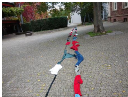
學校迎新-脫去幾乎所有衣物