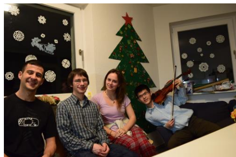
聖誕假期前的聚會