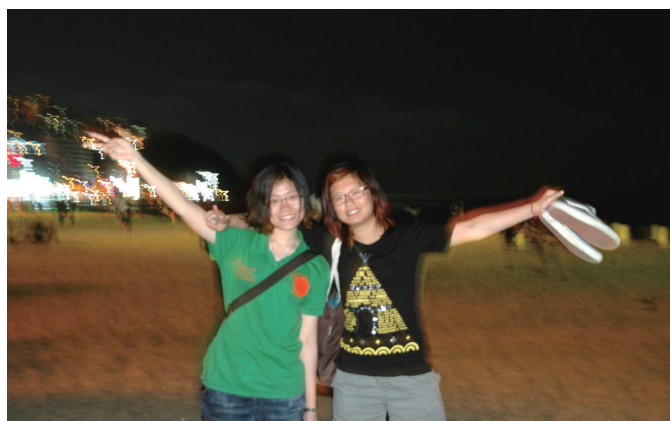
赤腳在海雲台海水浴場。釜山