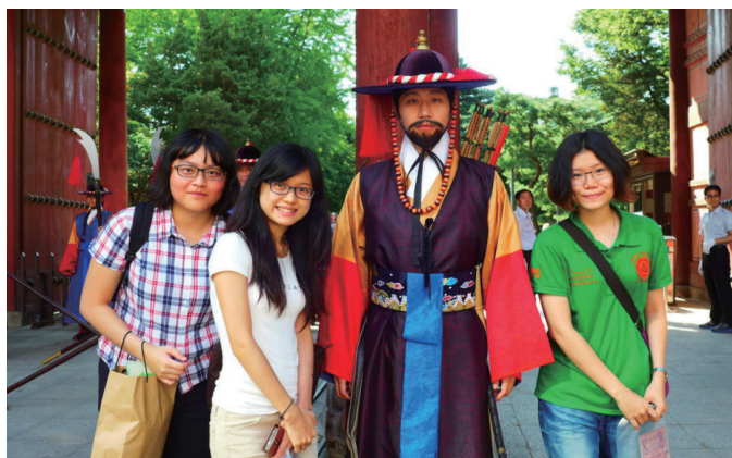
德壽宮與守門將合影。首爾

再遠一些的地方，就是和朋友一起去了韓國南邊的釜山，去尝尝最道地的海產與生魚片，還有還有赤腳在沙灘上狂奔、感受海風吹來的暢快。