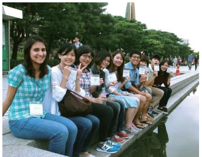
Seoul Mate 活動合影。戰爭博物館。首爾