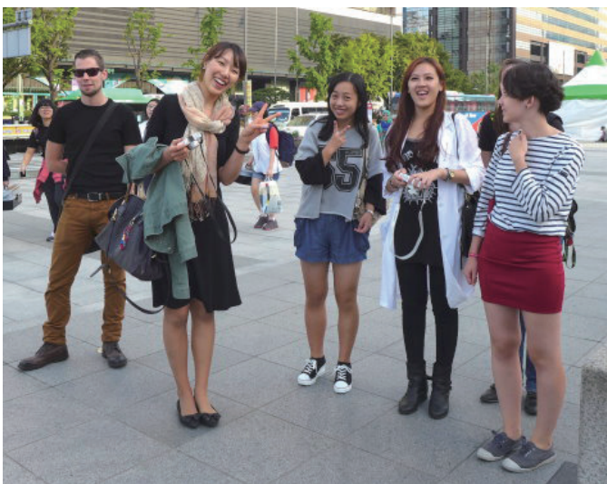
韓文班出遊。光化門廣場。首爾

還可以參加免費的首爾導覽活動 - Seoul Mate，提供各種不同的導覽路線，並且有志工沿路解說一同遊玩。如此一來，就不會只是走馬看花，而是較深入地去了解各個景點。我參加的路線是從光化門廣場到戰爭博物館，最後還與韓國導覽員一同唱起了韓國民謠阿里郎。