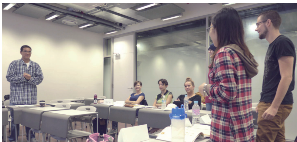
第一學期 - 韓文班上課時在玩的 369 拍手小遊戲

這些和臺灣不同的學習經驗都讓我印象非常深刻，也藉此練習英語能力。另外，因為一起上韓文班的同學都來自不同國家，所以也因此認識了許多國外的朋友！課餘之際還會一起出去玩或者共同享用午、晚餐。還相約如果到彼此的國家，一定要當當地陪才行。