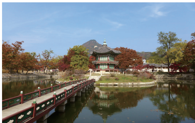
韓國古代宮廷建築。景福宮 - 香遠亭。首爾