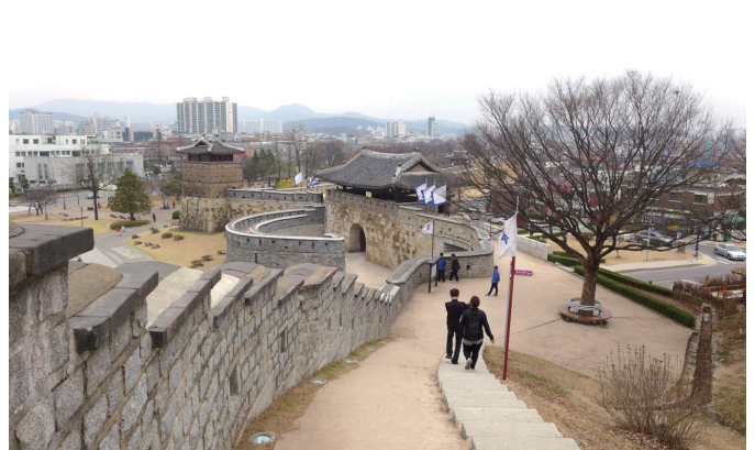
散步在水原華城的城牆上。水原，京畿道