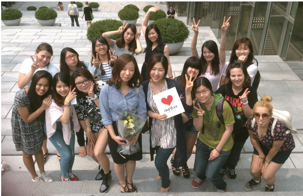
第二學期 - 韓文班師生合影