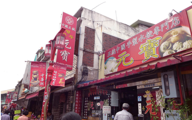
韓國的中國城唐人街。仁川