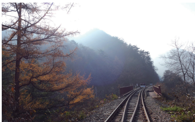
春川鐵道腳踏車之行。京畿道