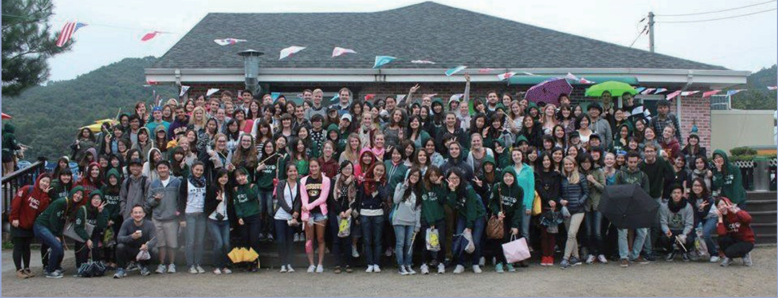
↑ Farm Experience-buddy 與交換生全體合影