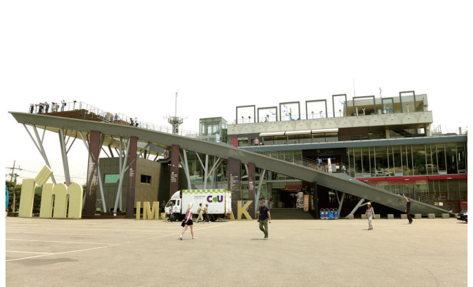
臨津閣國民觀光地的標的建築。坡州，京畿道