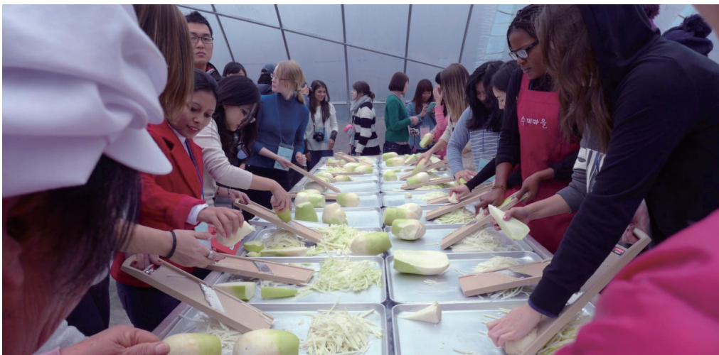
← 1-Day Korean Culture Field Trip- 泡菜製作

另外，韓文班的同學之間也會相約一起出遊或者吃飯、唱 KTV 等，這是增進同班感情一個很好的機會。韓文老師也曾在創造韓文的紀念日裡，帶著全班一起去光化門出遊，逛世宗大王故事館，並且共進晚餐。每一次如同這樣的活動都能夠促進全班的感情。