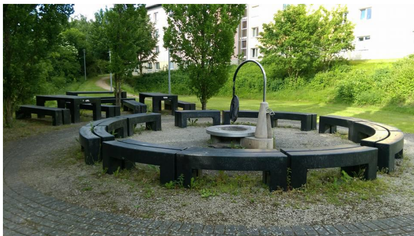
* 宿舍後面設備完整的烤肉場地

Petrisberg 宿舍提供了許多公共設施讓學生免費租借，像大廚房、派對房、烤肉場地等，只要押金 30 歐元即可租借場地，很適合邀請朋友們來宿舍同歡共樂。