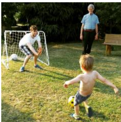
* Buddy 與姪子玩球

關於活動與交友，除了從學校課堂上認識同學，我從特里爾大學(非本交換學校)網頁找到可以申請 Buddy 的管道(本交換學校目前無提供 Buddy 配對)，藉由這個管道認識了一位非常照顧我的德國朋友，他在一開始帶著我熟悉特里爾城市的環境，在我皮膚過敏的時候帶我去看醫生，平常在我有問題的時候也都能為我解答，與我們野餐、郊遊，也邀請我去他的家鄉吃飯，很幸運認識了一位非常照顧我的德國朋友。圖為 Buddy 與姪子玩球；圖為與 Buddy 家人用餐照。