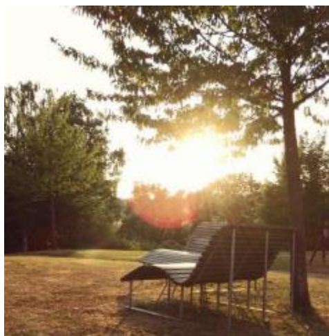
* 宿舍外草地公共大躺椅

在台灣我幾乎沒有機會為自己下廚料理三餐，在德國的日常生活中，最重要的就是學習煮飯，德國超市的食材都很便宜，自己料理三餐比起去餐廳吃可以省下不少的花費，我在這半年成功做出了許多好料理，下面的圖片皆為自己所做的菜，很多東西都是從最原始的原料開始製作，學習了這些後，覺得沒有什麼東西是做不到的，這些在我離開台灣前完全沒嘗試過。