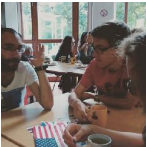
* 特里爾大學交換語言之夜

如果對語言交換有興趣的話，特里爾大學(非本交換學校)每個禮拜都有 SprachAbend 活動，那裡提供免費的茶飲點心，語言則有英文桌、德文桌、法文桌、西班牙文等，在這裡很容易認識到許多來自各地的朋友，非常值得一去。特里爾大學(非本交換學校)不定時會舉辦很多活動，像是 Party、BBQ、健行、運動等各類型活動，也都有開放給來自各地的學生參加，喜歡參加活動的請多加追蹤。