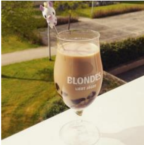
* 自己揉粉製出的珍珠