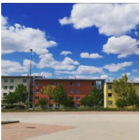
* Petrisberg 宿舍外觀

關於住宿與烹飪，生活中最貼近自己的就是宿舍了，我覺得自己非常幸運住了一間環境非常棒的套房，我住的是 Petrisberg 區域，離特里爾大學(非本交換學校)很近，這裡的套房空間很寬敞，每個人的房間中都擁有一個功能完整的小廚房，以及一間很大的浴室，陽光照進來時格外溫暖，住起來非常舒服。宿舍外環境也很好，有許多植物，空氣清新，還有幾個公用的大躺椅，許多人喜歡在下午接近傍晚時刻坐在上面看書、聊聊天曬太陽。這裡唯一的缺點就是交通較不方便，距離特里爾應用科技大學也較遠，如果修課不多，這裡是一個非常棒的選擇喔！