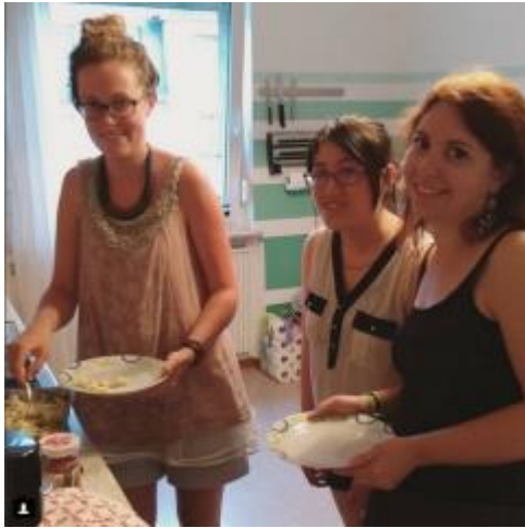
* 朋友家做菜：奧地利焗烤奶油麵