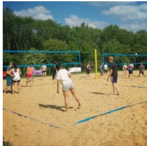
* 學生沙灘排球分組賽

雖然人在國外，你也很有可能認識來自相同國家、說相同語言的朋友，我在特里爾認識了幾位來自台灣、香港的女孩，大家一起做了很多事情，感情也很要好，我們也時常邀請自己的外國朋友一起聚聚，彼此認識，在特里爾這個小城留下了許多難忘的回憶。