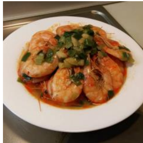
* 雕花酒西班牙大明蝦

Petrisberg 宿舍提供了許多公共設施讓學生免費租借，像大廚房、派對房、烤肉場地等，只要押金 30 歐元即可租借場地，很適合邀請朋友們來宿舍同歡共樂。