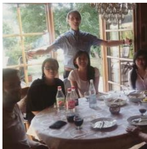
* 與 Buddy 家人用餐

有時候也可以試著找找看有沒有願意與你作語言交換的語伴，我在某個特里爾交換語言的社團中認識了一位對中文有興趣的德國女孩，我們在特里爾時常相約見面，最常做的事情就是煮飯了，我邀她與她的朋友來我這做中式料理，而下一次就換她準備歐洲料理，邊吃邊交流彼此文化，覺得很棒。同時你也有機會認識來自其他國家的交換學生，大家也會一起去餐廳吃飯、烤肉、參加各式活動。