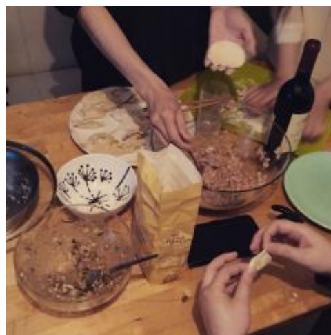
* 邀請國外朋友一起包水餃