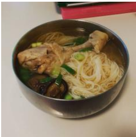
* 萬能電鍋煮出的麻油雞