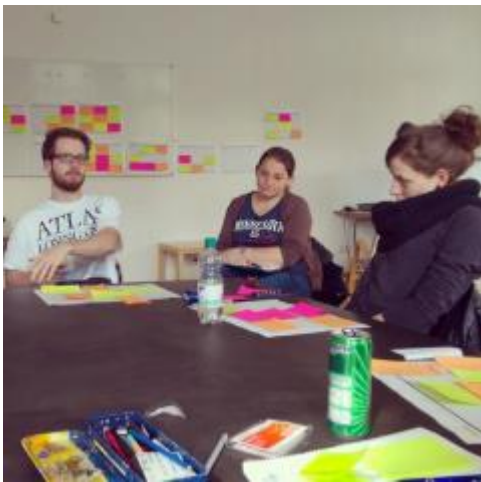
* 點子腦力激盪活動

此課程在一開始老師會講課，傳授一些網頁/APP 使用者經驗的知識，以及設計開發使用者介面的流程，並且時常有小活動或小練習讓學生現學現用，下面圖左為課堂中腦力激盪的活動照，大家將自己的想法寫在不同顏色的便利貼上，彼此腦力激盪對不同的想法再次提出自己的想法。而圖右為我與我的組員課餘時間開會討論專案的照片。