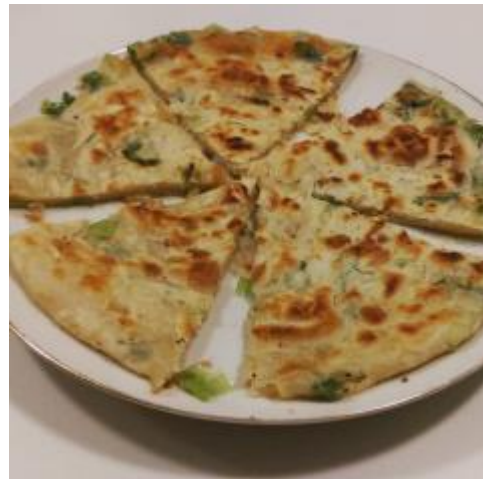
* 自己揉麵粉做的蔥油餅