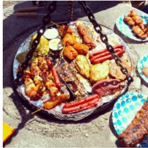
* 邀請朋友來宿舍烤肉

如果對語言交換有興趣的話，特里爾大學(非本交換學校)每個禮拜都有 SprachAbend 活動，那裡提供免費的茶飲點心，語言則有英文桌、德文桌、法文桌、西班牙文等，在這裡很容易認識到許多來自各地的朋友，非常值得一去。特里爾大學(非本交換學校)不定時會舉辦很多活動，像是 Party、BBQ、健行、運動等各類型活動，也都有開放給來自各地的學生參加，喜歡參加活動的請多加追蹤。