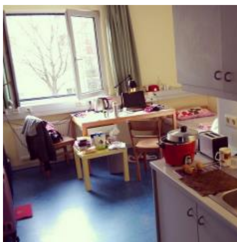
* 我的房間照，設備完整、空間寬敞