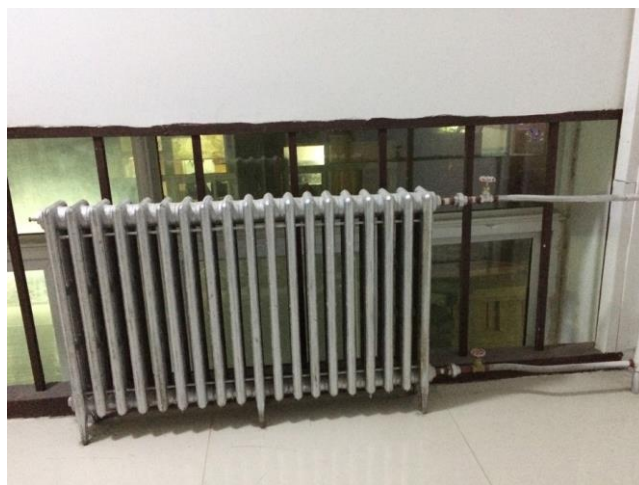
圖五 北京室內暖氣設備

許多人來北京首先最擔心的就是空汙問題，基本上空汙的霧霾會隨著好天氣的日子增長而日益嚴重，過一陣子會因為刮大風而南移，接著又恢復到萬里無雲的天氣，如圖六，以三個月天數的比例來說，空汙嚴重的日子大概佔了三分之一。空汙情況輕微時，是當你回到房間用面紙挖挖鼻孔時，會發現有灰塵殘留在裡面；而嚴重時在外面甚至連呼吸都會覺得很不舒服，最好是攜帶 N95 等級的口罩，因為一般的口罩無法抵擋這邊微小的灰塵顆粒。但屏除掉大風以及空汙的問題，天氣好的北京還是挺美的。