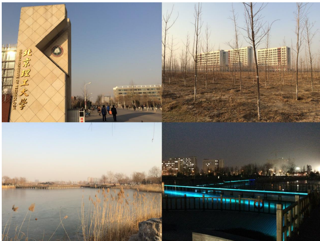
圖一 北理工良鄉校區