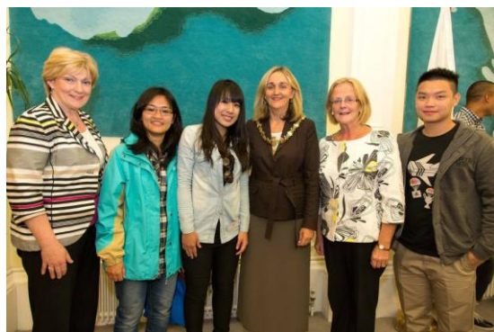
與市長見面，全校只有 3 個華人