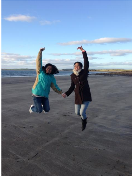
Sligo 景點-Rosses point