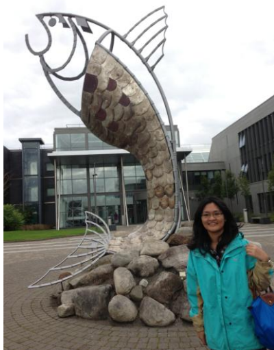
學校裡最顯眼的地標-魚

在歐洲學習和在台灣學習真的差很多。第一，在台灣上課，通常是老師在台上一直授課，與學生的互動較少，老師教什麼，台灣學生就接受什麼，不擅於發言、思考和反駁，但在歐洲上課，老師們很注重與學生之間的互動，歐洲主要在培養學生思考的能力，在課堂中的問題都是沒有正確答案的，主要是讓同學時不時動腦思考，並開口表達意見，師生之間就像朋友一樣的教學相長。第二，雖然他們學生的出席率不高，但每當有報告時，必需自己找資料或題材時，他們總能迅速並有效率地找出所需的資訊。第三，在升大四之前，他們都必須去實習，而到大四後，他們不在只是學習書中的知識和理論，老師們都會要他們想一個計畫書，與他們實習的經驗相結合，也就是實務和理論的結合。