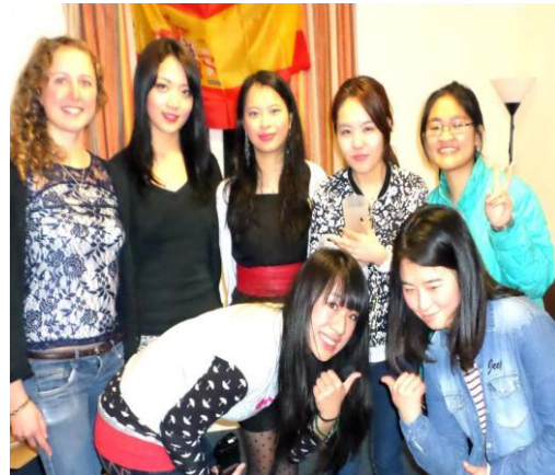
宿舍辦朋友生日派對