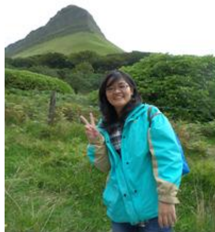
Sligo 景點-Benbulbin mountain