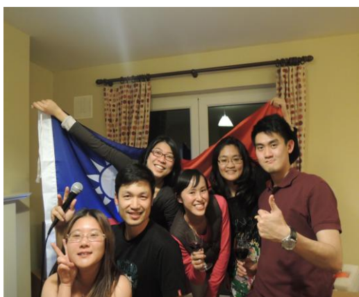
跟所有在愛爾蘭的台灣人們慶祝雙十節