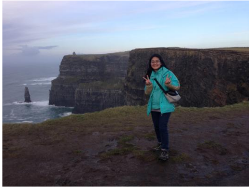
Galway 著名景點(約 2.5 小時車程)-Cliffs of Moher