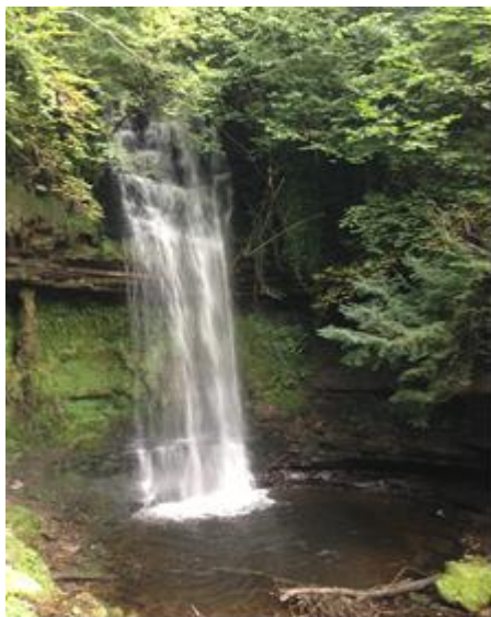
Sligo 景點-glencar waterfall

IT, Sligo 位於愛爾蘭西北部大西洋沿岸的 Sligo，居民非常友善和熱情，且學校的老師們也都很好，風景和空氣也佳，且愛爾蘭又是英語系國家，所以溝通上相較其他歐洲國家容易。