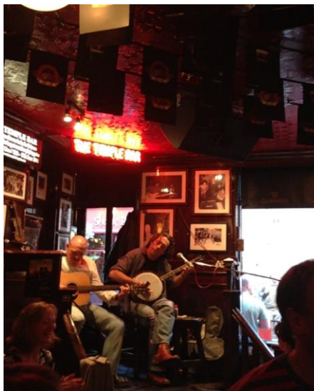
Dublin 著名景點(約 4 小時車程)-temple bar