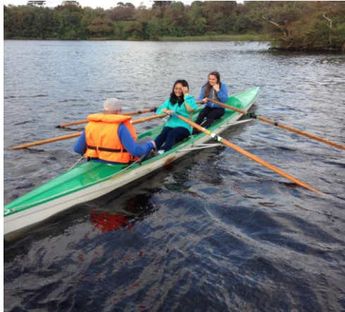
在 Sligo, 划船初體驗