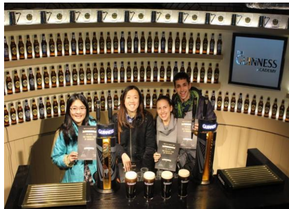
Dublin 著名景點-Guinness Store