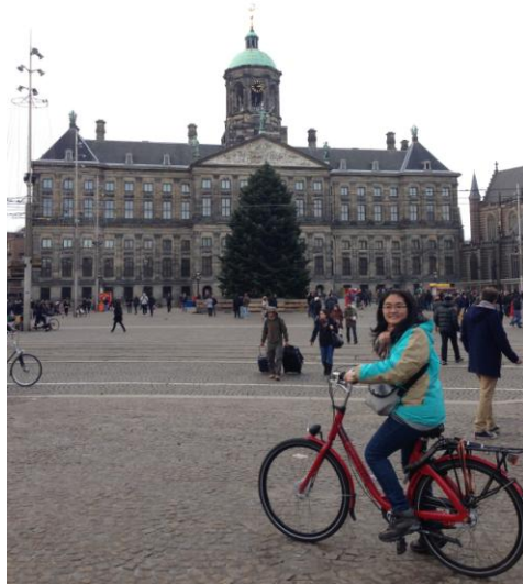
在荷蘭體驗騎腳踏車生活