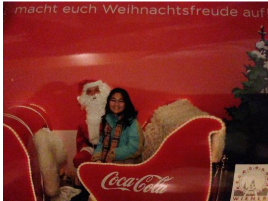
聖誕節度假 遇見聖誕老公公