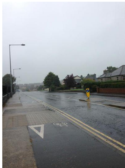
三不五時就下著大雨的愛爾蘭