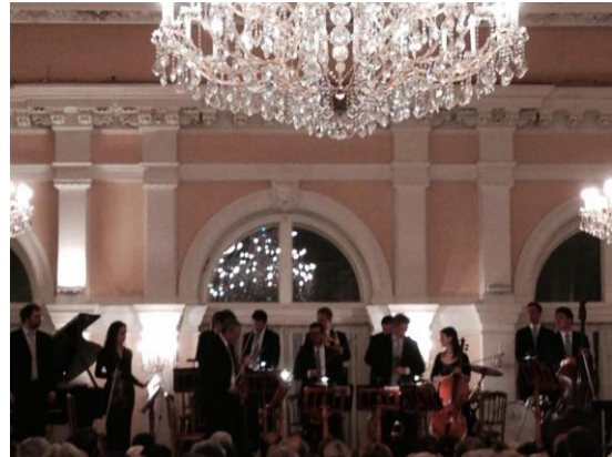
在維也納聽莫札特演奏會