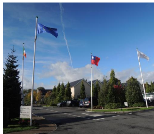
看台灣國旗在異國飄揚著 好感動