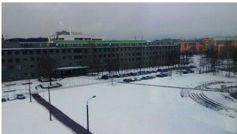
宿舍房間看出去的校園