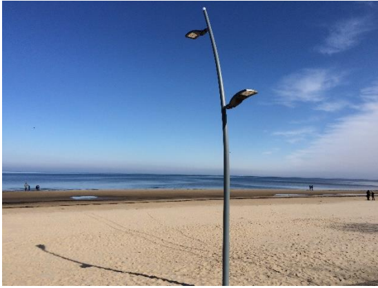
尤馬拉離里加約 30 分鐘車程