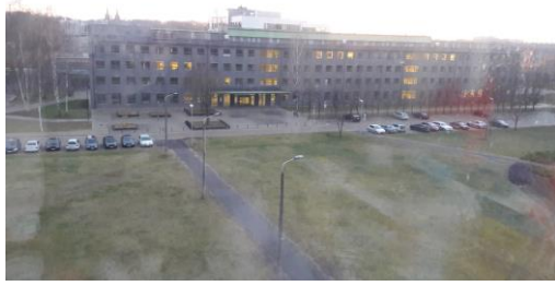
里加 4 月晚上 9 點的天色