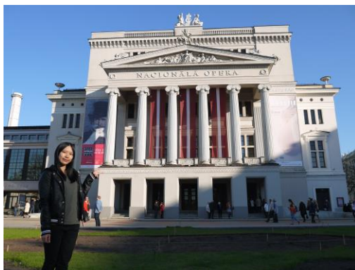
拉脫維亞-里加歌劇院

建議 ：因為拉脫維亞簽證只能在當地辦理，建議去拉脫維亞的交換生搭乘土耳其航空前往拉脫維亞，土航託運可帶 30 kg，在伊斯坦堡轉機也不會檢查簽證，盡量不要搭乘德航，不然在德國轉機時檢查到沒有簽證又要在歐洲待超過 3 個月，就會被遣返回台