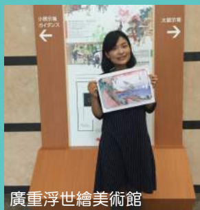
廣重浮世繪美術館