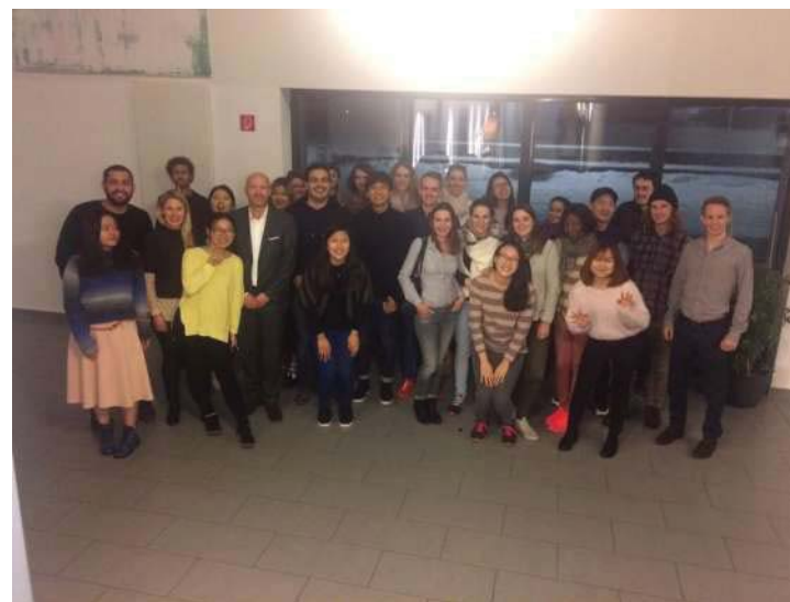
Meeting all professors and students