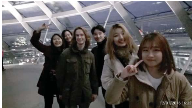
參訪德國國會大廈(柏林)

除了全班一起走訪柏林，這次交換趁著周末與聖誕假期，我還拜訪了附近的國家，包括英國、法國、布拉格、奧地利。也參觀了許多知名的大博物館包括羅浮宮、大英博物館，其中在羅浮宮看到的畫作：自由領導人民，更是令我感動許久。歐洲的建築令人嘆為觀止，並且歐洲保存古蹟的積極性，也讓我不由得豎起大拇指。德國很注重環保，到超市可以看到每個人都有準備購物袋，我也養成了這個習慣。