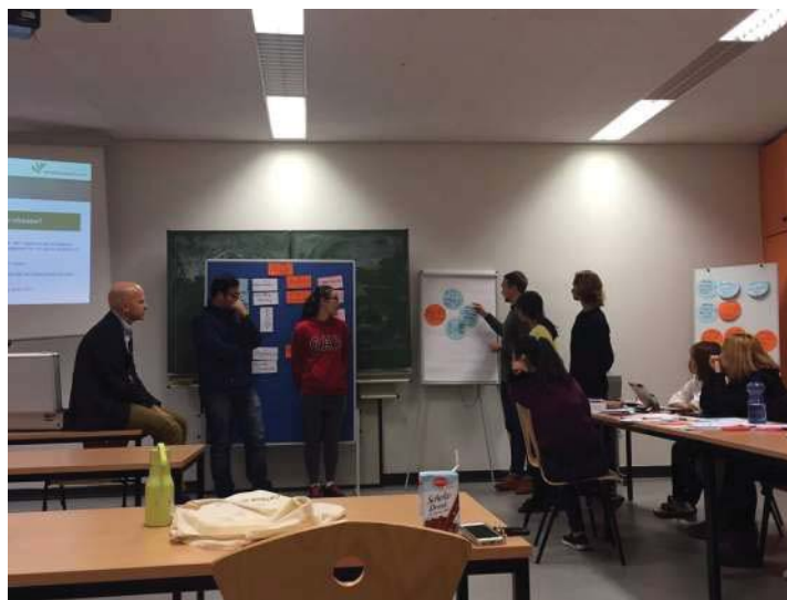
Group discussion during class

德國的大學分為夏學期和冬學期。因此他們每個學期都會有新生加入。德國的教育注重很多面向，課堂上我們被要求要踴躍發言，也時常會有腦力激盪與團隊合作，此外，學校還提供了德語課程，讓國際學生更有條理及方向的學習德文、融入德國環境。