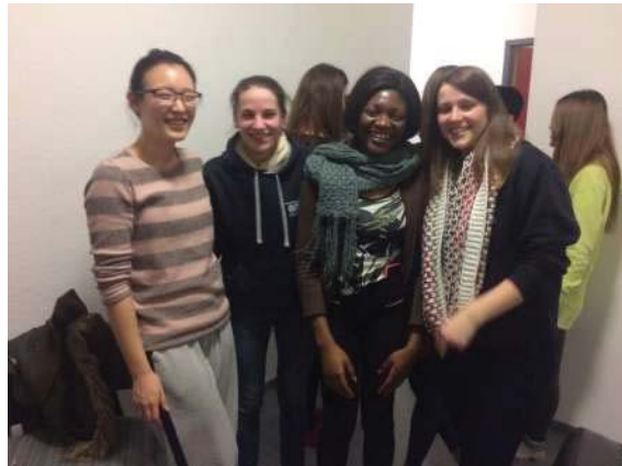
班上的韓國與法國女孩

在德國，三四個人一起喝酒就能被他們稱作party，學校生活中，尤其是周五晚上常可以在宿舍各處聽到大聲的音樂，在party中，可以很快地了解各個國家的文化。