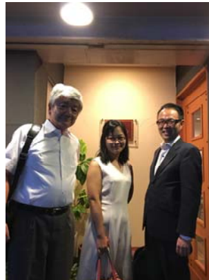
平松及松井老師為我餞行