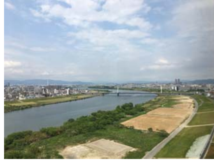
10F辦公室窗外的美好