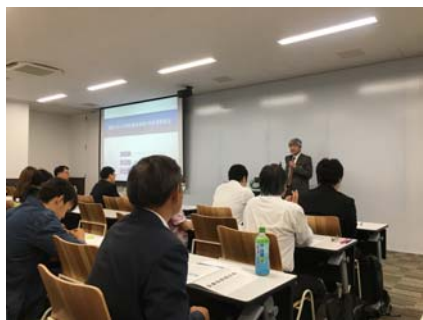
韓國知的財產セミナー