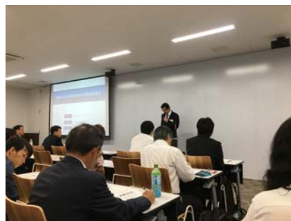
韓國知的財產セミナー