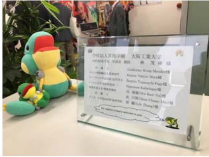
參觀株式会社エンジニア