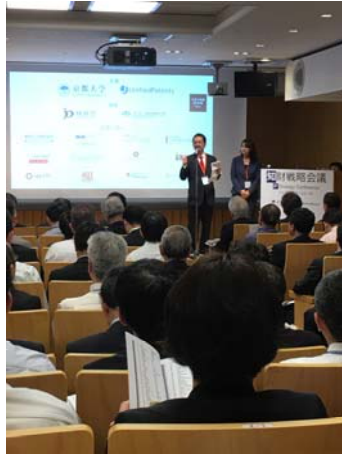
京都大學-智財策略研討會