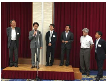
夏季集中講義開場