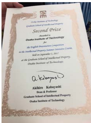
夏季集中講義榮譽-比賽第二名