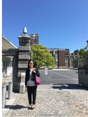
京都大學-智財策略研討會