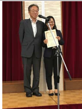
夏季集中講義證書頒發