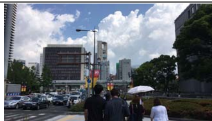
前往高等法院參觀及旁聽