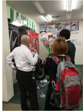
參觀株式会社エンジニア