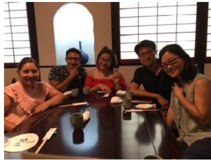
與JICA和WIPO研究員一起去鰻魚餐廳