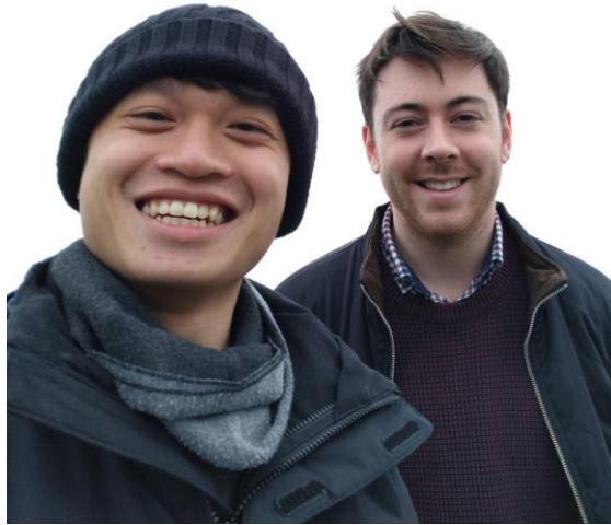
Met a friend from London