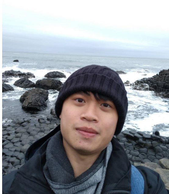
Giant' s Causeway