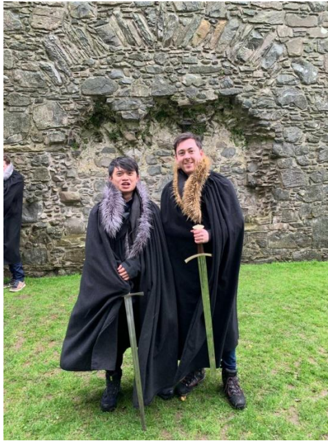
Game of Throne Trek in Belfast

Cork、Waterford、Dublin、Belfast、Derry，我認為在愛爾蘭國內遊歷是非常值得的。