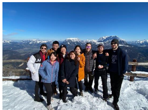
爬到離學校最近山的山頂