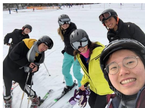
與其他交換生去學校附近的滑雪場