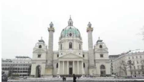
位於學校行政中心旁的卡爾教堂