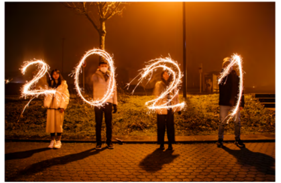
上：在宿舍前和朋友一起跨年 中：法蘭克福街頭漫步 左下：和朋友在宿舍門外玩雪 右下：宿舍旁的地標—盧森堡塔