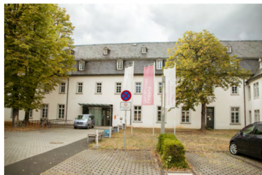
主校區全景 設計學院系館一隅