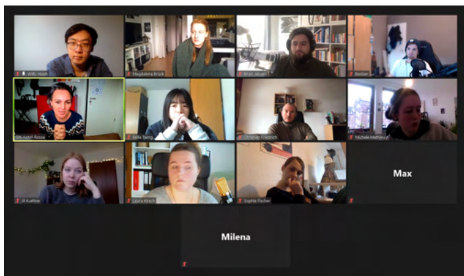
我的Filmtheorie期末報告之一